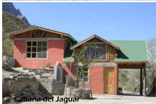
Cabaña del Jaguar