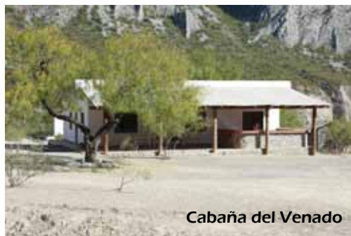
Cabaña del Venado

Agroecología/ Ecoturismo/ Yoga/ Cocinay alimentación saludable / Música prehispánica